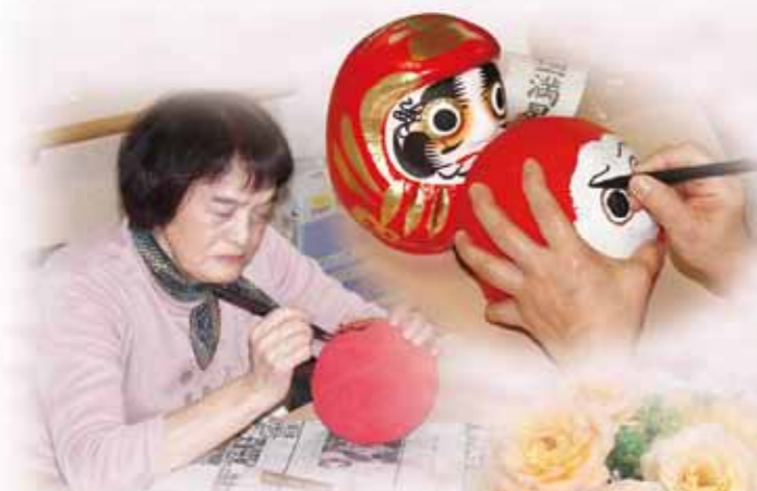
縁起物 だるまづくり