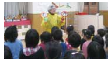
平成23年3月の啓発活動

法務局の相談所に直接お越しになれない地域住民の方々に心配事や困りごとの相談業務を人權擁護委員や弁護士の方々が無料で行います。当日は啓発活動としてマスコットキャラクターの人KENまもる君とあゆみちゃんによる子ども園での交流も予定されております。