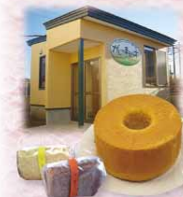
パン・菓子工房オープン!