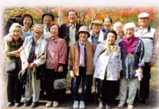
ケアハウス 紅葉ドライブ