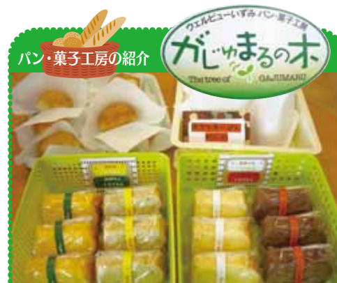
パン・菓子工房「がじゅまるの木」

パンとお菓子の工房「がじゅまるの木」が10月にオープンし、現在カレーパンとシフォンケーキを「喫茶うえるびゅー」で販売しております。どちらの商品も安くて美味しいという評判で注文も頂けるようになりました。がじゅまるの木は「多幸の木」と呼ばれていますが、この工房からささやかな幸せを手作りのパンとお菓子に込めて皆様にお届けしたいとがんばっています。