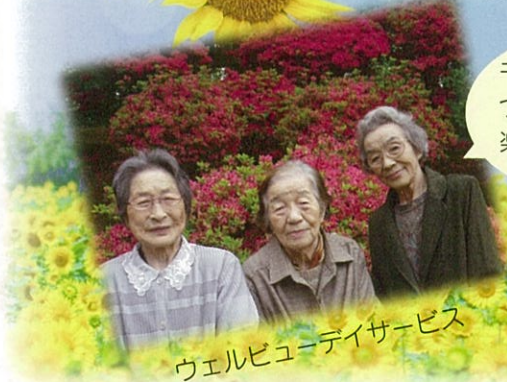
ウェルビューデイサービス