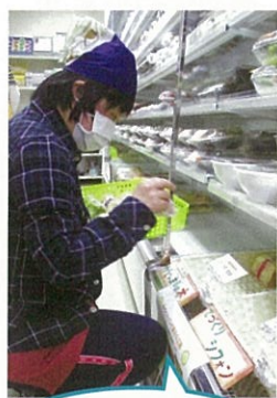
中通総合病院売店で販売開始。毎日充実だよ!!

今年4月から中通総合病院の売店にて、パン・菓子工房「がじゅまるの木」のシフォンケーキを販売させて頂いております。現在、一日限定30個の販売ですが、ご好評頂き全てその日に完売となっています。利用者職員で午前中に配達に行き、店員さんに挨拶してから棚に陳列するのが日課となっていますが、空っぽになったカゴを見ると何とも言えない嬉しさがあります。また、店員さんやお客様との