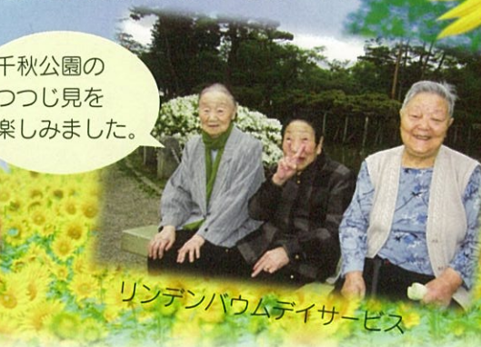
リンデンバウムデイサービス