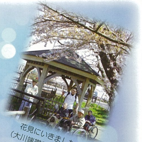
花見にいきました (大川端带状近隣公園)