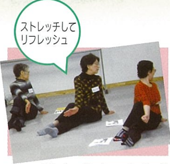
ストレッチしてリフレッシュ

秋田市委託事業「地域型はつらつくらぶ」を泉地区(会場/ウエルビューいづみ交流プラザ)で6月から3月まで月1回第3木曜日に開催しています。はつらつくらぶ事業は、高齢者の運動機能向上、閉じこもり防止および介護予防一般に関する知識の普及啓発をする事で、要支援・要介護状態になることを予防し、地域で健康でいきいきとした生活が送れるよう支援する事を目的としています。