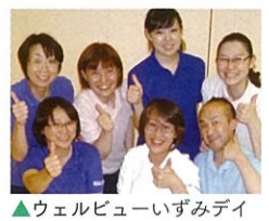
▲ウエルビューいづみデイ

また、当センターではこのような介護予防に関する事業以外にも、泉・保戸野地区にお住まいの高齢者の介護・生活・福祉・医療等様々な相談を受け付けております。何かお困りな事がございましたらお気軽にご相談ください。電話(896)5960