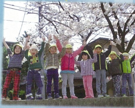
つばめ組に進級したよ！バンザーイ！！