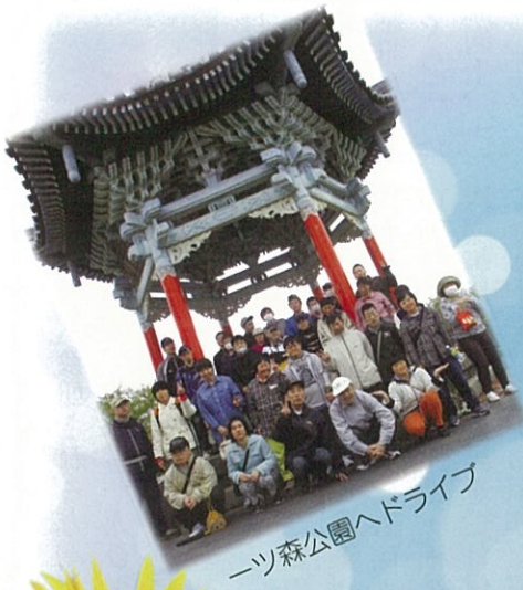
一ツ森公園ヘドライブ

発行 社会福祉法人 いずみ会 秋田市泉菅野二丁目17番11号 TEL.018-896-5880