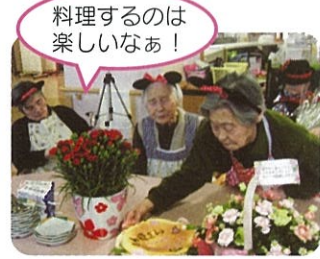
料理するのは楽しいなあ!

特別養護老人ホームリンデンバウムいづみ 特養では今年、母の日も、女性の皆さんを中心に大いに盛り上がりました。3階ではパンケーキ作り、2階ではアイスクレーションと、どちらもスイーツッキングを行いました。パンケーキ作りでは、生地の大きさや焼き具合を念入りに確認したり、あんこやチョコレート等のトッピングに迷ったりしながら思い思いに作っていました。