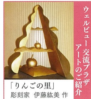
「りんごの里」 彫刻家 伊藤紘美 作