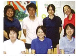
▲リンデンバウムいづみデイ

今年度は昨年同様、健康運動指導士の方を講師に迎え、介護予防体操と定期的な体力・身体測定を実施しています。最近注目されている ※ ロコモティブシンドロームを予防する為の筋力トレーニングやストレッチで全身の筋肉をほぐし、腰痛や肩こりを予防・改善する方法等を学んでいます。参加者の方々から「運動した後、体がスッキリする」「みんなが集まると楽しく運動が続けられる」と、とても好評な声が聞かれます。