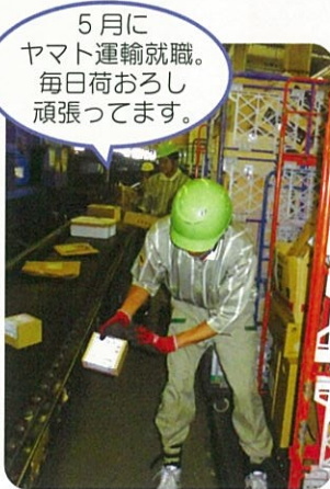
5月にヤマト運輸就職。毎日荷おろし頑張ってます。

平成25年度は、「働きたい」という思いを「働いています」にするため4名のスタッフ一同サポートをしてきました。今年度も一人ひとりの思いを叶えられるよう頑張ります。