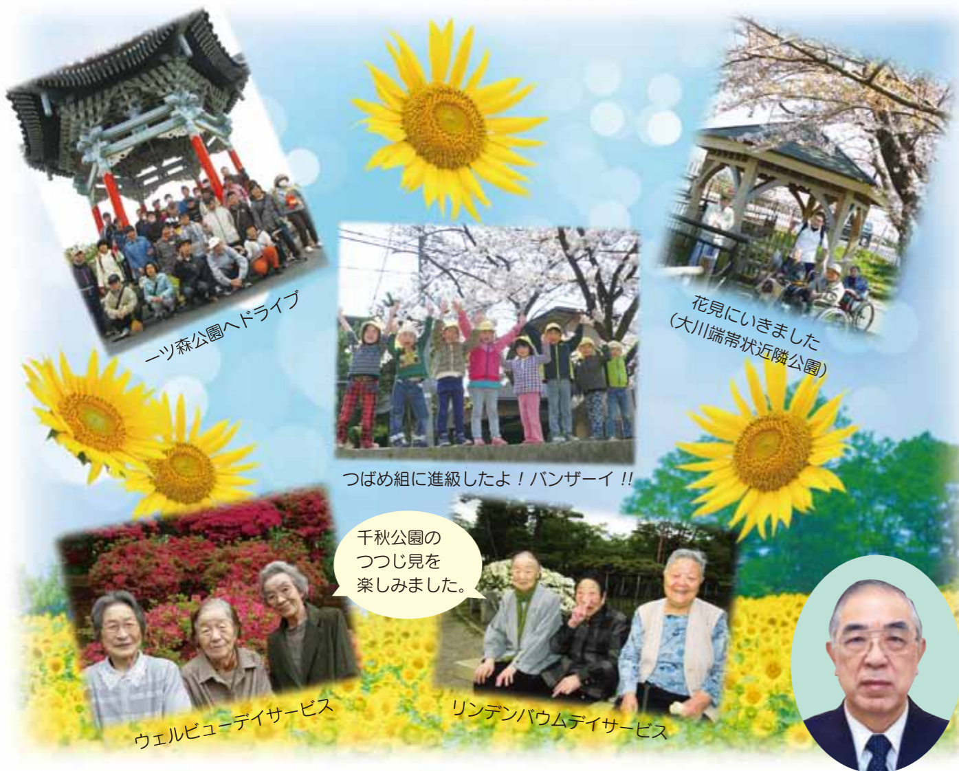
一ツ森公園ヘドライブ

発行 社会福祉法人 いずみ会 秋田市泉菅野二丁目17番11号 TEL.018-896-5880