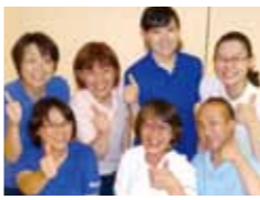
▲ウエルビューいずみデイ

泉地区の沿線にピンク色眩しく8階建てのリンデンバウムいずみ、そして、寄り添うように3階建てクリーム色のウエルビューいずみ、それぞれの建物の中にデイサービスがあります。両施設の職員は利用者の方から信頼され安心される介護士をめざしております。いずみ会の理念を胸に、今年度の目標を皆で話し合い、笑顔・感謝・