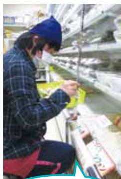
中通総合病院売店で販売開始。毎日充実だよ!!

今年4月から中通総合病院の売店にて、パン・菓子工房「がじゅまるの木」のシフォンケーキを販売させて頂いております。現在、一日限定30個の販売ですが、ご好評頂き全てその日に完売となっております。利用者と職員で午前中に配達に行き、店員さんに挨拶してから棚に陳列するのが日課となっておりますが、空っぽになったカゴを見ると何とも言えない嬉しさがあります。また、店員さんやお客様との