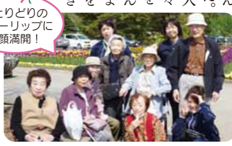
色とりどりのチューリップに笑顔満開!

当日は、天候に恵まれ長く歩くことに自信の無い方も歩行器や車椅子を利用し、自分のペースで楽しんでいました。今後も入居者の方々に、季節を感じ楽しんで頂けるような企画を考えたいと思います。