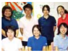
▲リンデンバウムいずみデイ