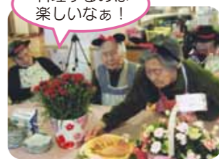
料理するのは楽しいなあ!

特別養護老人ホームリンデンバウムいずみ 特養では 今年の母の日も、女性の皆さんを中心に大いに盛り上げました。3階では パンケーキ作り、2階ではアイスデコレーションと、どちらもスイーツッキングを行いました。パンケーキ作りでは、生地の大きさや焼き具合を念入りに確認したり、あんこやチョコレート等のトッピングに迷ったりしながら思い思いに作っていました。