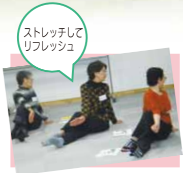
ストレッチしてリフレッシュ

秋田市委託事業「地域型はつらつくらぶ」を泉地区(会場/ウエルビューいずみ交流プラザ)で6月から3月まで月1回第3木曜日に開催しています。はつらつくらぶ事業は、高齢者の運動機能向上、閉じこもり防止および介護予防一般に関する知識の普及啓発をする事で、要支援・要介護状態になることを予防し、地域で健康でいきいきとした生活が送れるよう支援する事を目的としています。