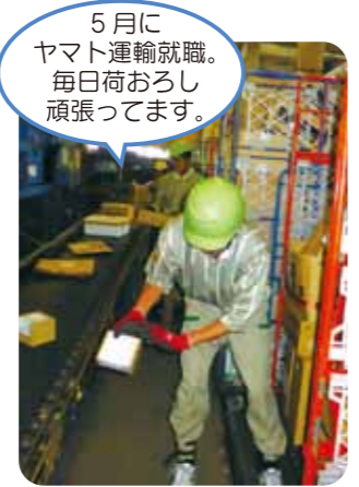
5月にヤマト運輸就職。毎日荷おろし頑張ってます。

平成25年度は、「働きたい」という思いを「働いています」にするため4名のスタッフ一同サポートをしてきました。今年度も一人ひとりの思いを叶えられるよう頑張ります。