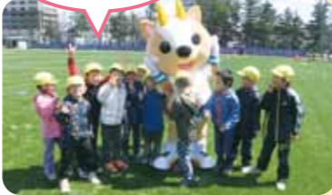
スポまるくんとなかよくなったよ~!

り転がったりして、伸び伸びと体を動かしました。「なんだか、ふわふわしているね」「転んでも痛くないね」とつぶやきながら、感動いっぱい体験することができました。その後5月のお楽しみ活動では、4歳児と5歳児が球技場を貸し切ってミニミニ運動会をしました。きまぐれな地域の良いところを十分に活用した保育の工夫をします。