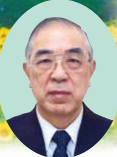
リンデンバウムデイサービス