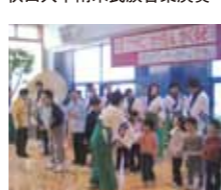
秋田ヤートセ「わけもん」