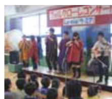
秋田大中南米民族音楽演奏