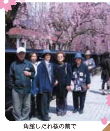
角館しだれ桜の前で

私たちの日常生活は、同じようなことの繰り返しです。平凡な生活にリズムをつけ、元気に暮らすために、ドライブや交流プラザの行事に参加します。