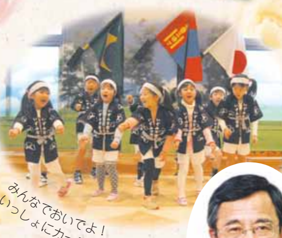
みんなでおいでよ！ いっしょにカーニバル