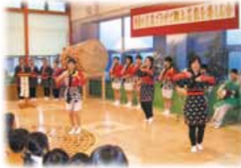
和洋高校郷土芸能