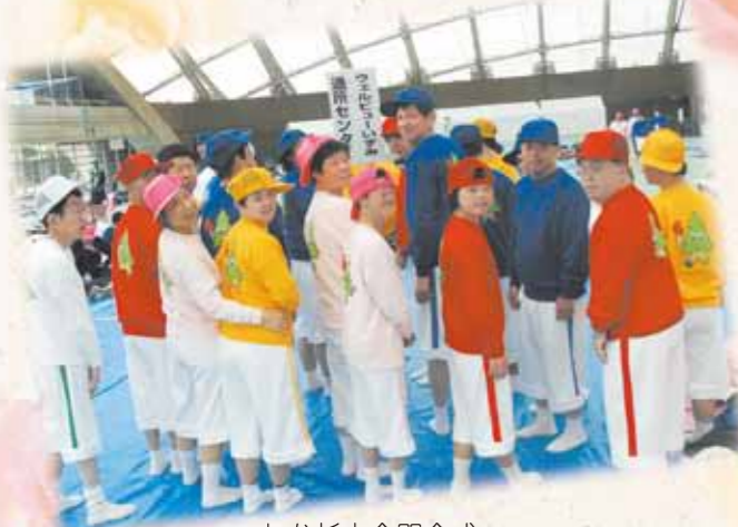
わか杉大会開会式