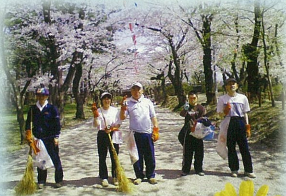
千秋公園桜の下で