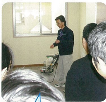
清掃講座の受講風景

『自立した地域生活をめざして』 障害者就業・生活支援センター 当センターは、厚生労働省の委託事業として平成16年にスタートし、労働・行政・医療・教育・一般事業所など様々な関係機関と協力・連携しています。昨年度の就職件数は26件、総相談件数は五千以上と年々増加傾向にあります。就業支援は、実習や訓練のあつせん、職場開拓の他、清掃会社の方を招いての清掃講座や就職後の定着支援を行っています。生活支援は、日常生活に必要な手続きや健康・金銭・食生活など個別の要望に応じた支援をしています。また、毎月、東部ガスやサンパル秋田の方々のご協力を得て、料理教室や気軽に相談をしたり仲間作りを目的とした「集いの場」を開催するなど余暇活動支援にも力を入れています。