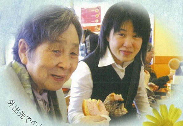
外出先でのドーナツ おいしかったわ〜

発行 社会福祉法人 いずみ会 秋田市泉菅野二丁目17番11号 TEL.018-896-5880