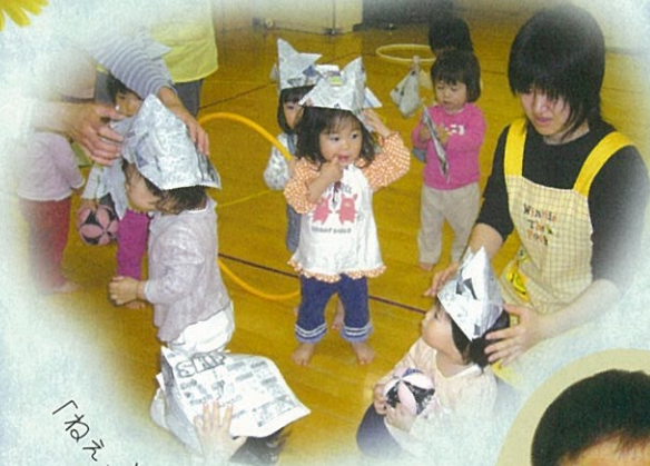
「ねえ、どう、にあうかしら？」