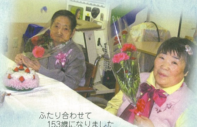
ふたり合わせて 153歳になりました