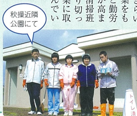
秋操近隣公園にて

を実践できる内容となりました。清掃活動は、就労訓練の実践の場であり、「きれいになったね」とねぎらいの言葉をもらうと勤勞意欲が高まり、清掃班は張り切って作業に取り組んでいます。