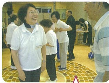
6月19日 はつらつくらぶ活動風景