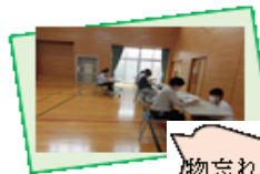
物忘れテストに集中

測定でドキドキ、ゲームでワイワイと「久しぶりに楽しかった」との感想が聞かれました。測定結果を参考に介護予防に取り組みましょう。