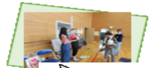
測定結果にビックリです。