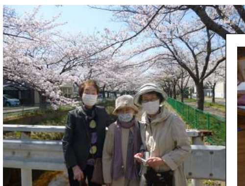
～ お花見ドライブ ～