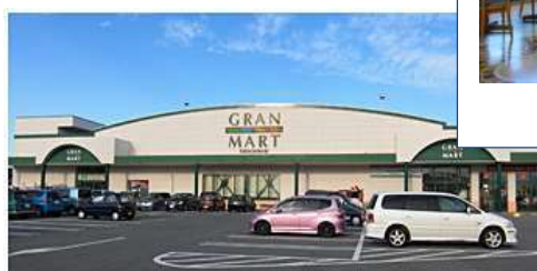
～ ショッピング ～