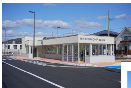
～ JR泉外旭川駅 ～