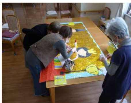
～ 貼り絵制作 ～