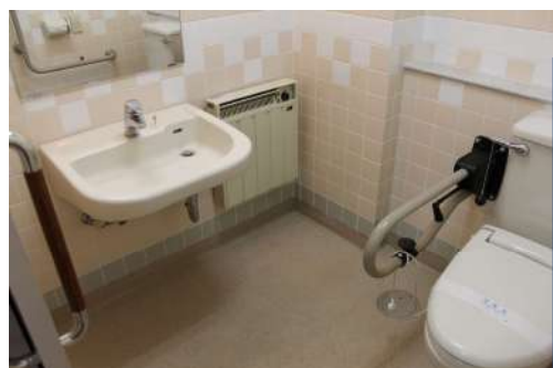
～ 洗面台・トイレ ～