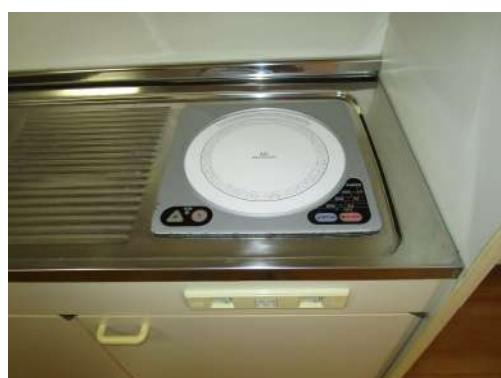
～ 電磁調理器 ～