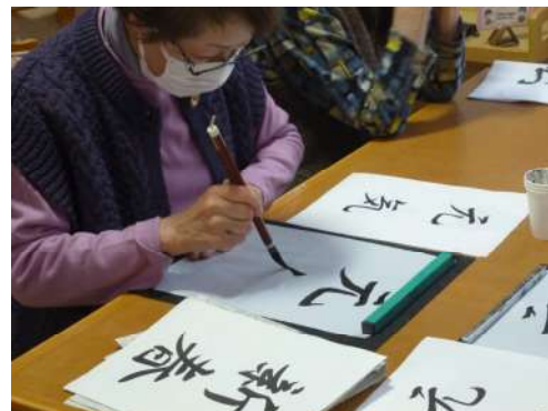
～ 書初め大会 ～