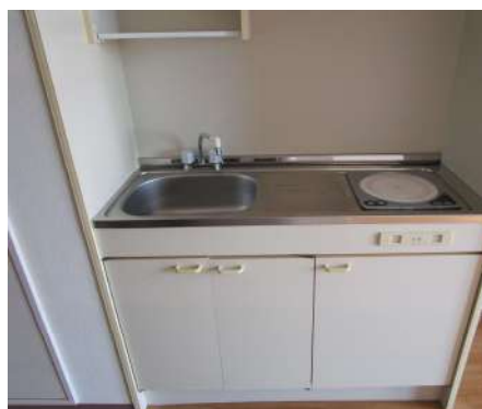
～ ミニキッチン ～