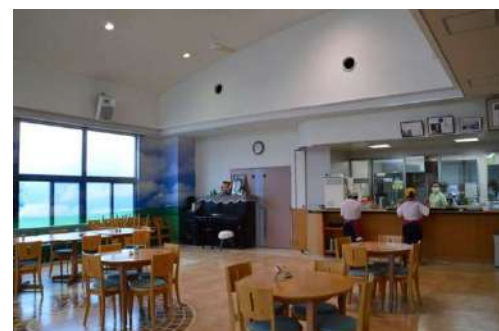
～ 喫茶うえるびゅー ～