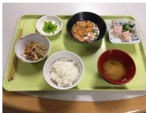
～ お食事（夕食の例） ～