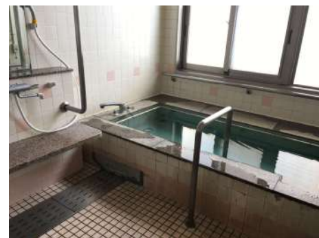
～ 浴場 ～