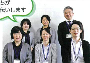
私たちがお手伝いします

ケアプランセンターには女性4名、男性2名の計6名のケアマネジャーが在籍しています。私たちは介護が必要になった方が住み慣れた地域でその人らしい暮らしが続けられるようお手伝いさせていただきます。介護が大変、介護保険のことが知りたい、話を聞いてほしい等々、介護のことでお悩みの方がいらつしやいましたらお気軽にご相談ください。相談ごとをお伺いし、利用者様の状況や希望に寄り添いながら適切な介護サービスを利用できるように一緒に考えます。介護の1歩はまず「相談」です。ご家族様以外でもお知り合いや近所さんなど、心配な方がおりましたらご相談ください。