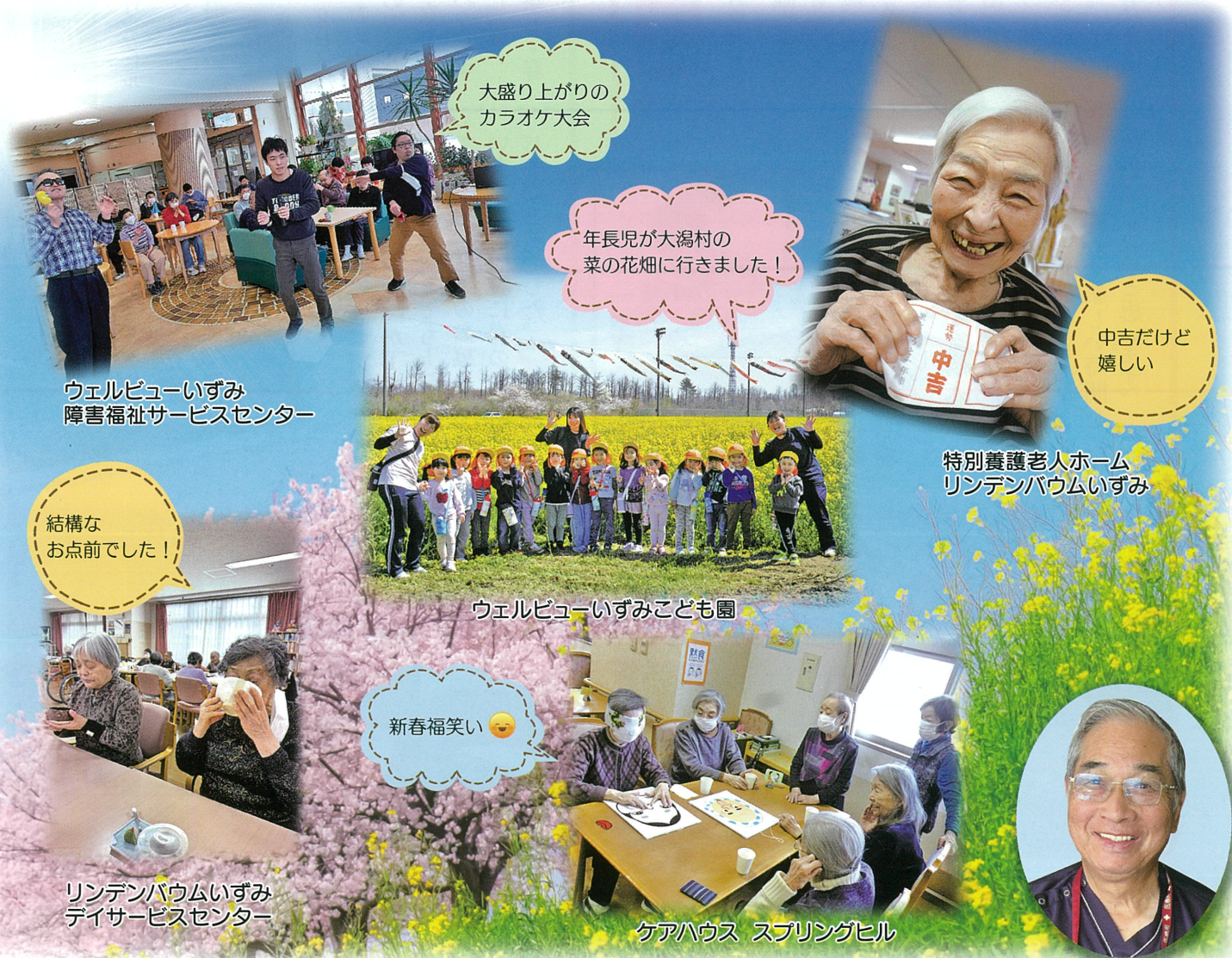
大盛り上がりのカラオケ大会

発行 社会福祉法人 いずみ会 秋田市泉菅野二丁目17番11号 TEL.018-896-5880 http://www.izumi.akita.jp