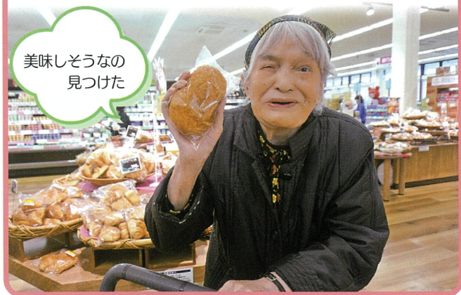
美味しそうな見つけた

久しぶりのスーパーでの買い物に興奮していました。直接品物を取り品定めし、美味しそうなお菓子を購入し、ひさしぶりのお買物をゆっくりと楽しんでいました。今後も利用者に喜ばれる行事を企画し、楽しい時間を一緒に過ごしたいと思っています。