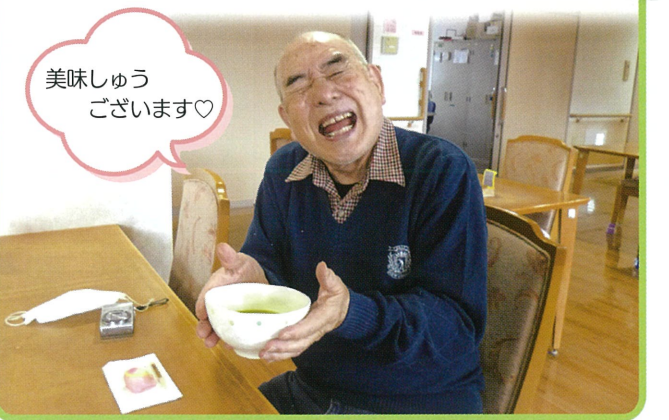
美味しゅうございます♡

の園遊会」と題してお茶会を開催しました。ケアハウスのお茶の師匠が丁寧に点てるお抹茶は、とても上品なお味です。おひな様のお菓子と共にいただき、優雅に春の訪れを感じるひと時でした。