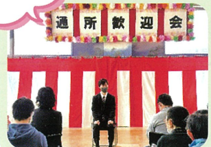
よろしくお願いします

小し、それぞれの部署に分かれての実施となりました。参加人数を減らしたことで例年より緊張感も少ない様子でリラックスした状態で臨むことができていました。歓迎会では新利用者からの挨拶や先輩利用者からそれぞれ祝辞を頂き温かな雰囲気の中で会を進行することができました。今年も気持ち新たに頑張りたいと思います。