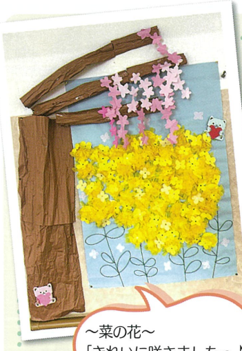
~菜の花~ 「きれいに咲きましたっ♪」